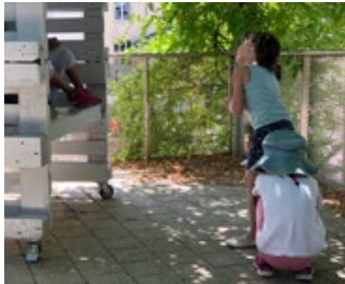
Arcus, Maison Relais Diekirch

Innerhalb der Maison Relais wird der Dialog mit und zwischen den Kindern in der pädagogischen Praxis stark gefördert. Zum Thema Konfliktmanagement zwischen den Kindern hat das Team in verschiedenen Ecken der Maison Relais sogenannte „Mediationsecken“ eingerichtet. Ziel dieser Ecken ist es, den Dialog zwischen den Kindern zu fördern und zu unterstützen. So kann nicht zuletzt im Falle eines Konfliktes zwischen mehreren Kindern auf diese Ecken zurückgegriffen werden, um zu diskutieren und die Situation zu schlichten. Durch diese Praxis lernen Kinder, ihre Gefühle und Standpunkte auszudrücken, aber auch ihre Empathie zu entwickeln. Mit dem Ausbau dieser beiden Fähigkeiten lernen die Kinder die darauffolgenden Konfliktsituationen besser einzuschätzen und bestenfalls sogar, sie zu entschärfen, bevor sie entstehen.