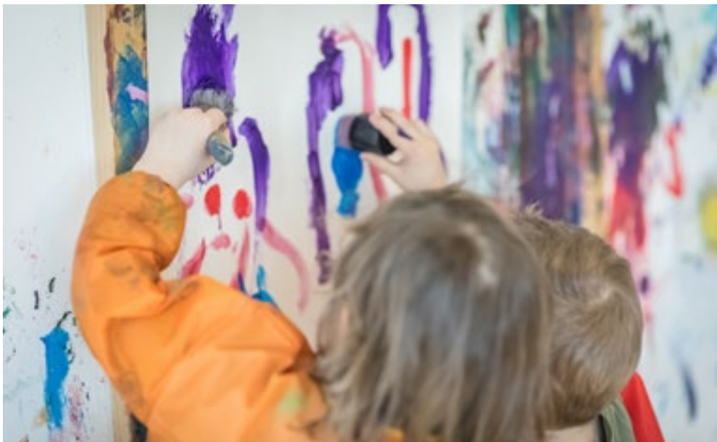
Arcus, Maison Relais Niederanven

Unterstützen können wir die Entwicklung der Autonomie also indem wir die Wünsche und Interessen der Kinder ernst nehmen und ihnen zeigen, dass wir ihnen etwas zutrauen. Deshalb sollten wir ihnen genug Zeit geben, um zu experimentieren und zu versuchen, Herausforderungen eigenständig zu bewältigen. Dabei sind auch einfache Situationen im Alltag ausschlaggebend: wie ziehe ich meine Schuhe an? Wie knöpfe ich meine Jacke zu? Merksätze wie „nichts tun, was das Kind selbst tun kann“ und „hilf mir es selbst zu tun“ können uns an diese Haltung erinnern.