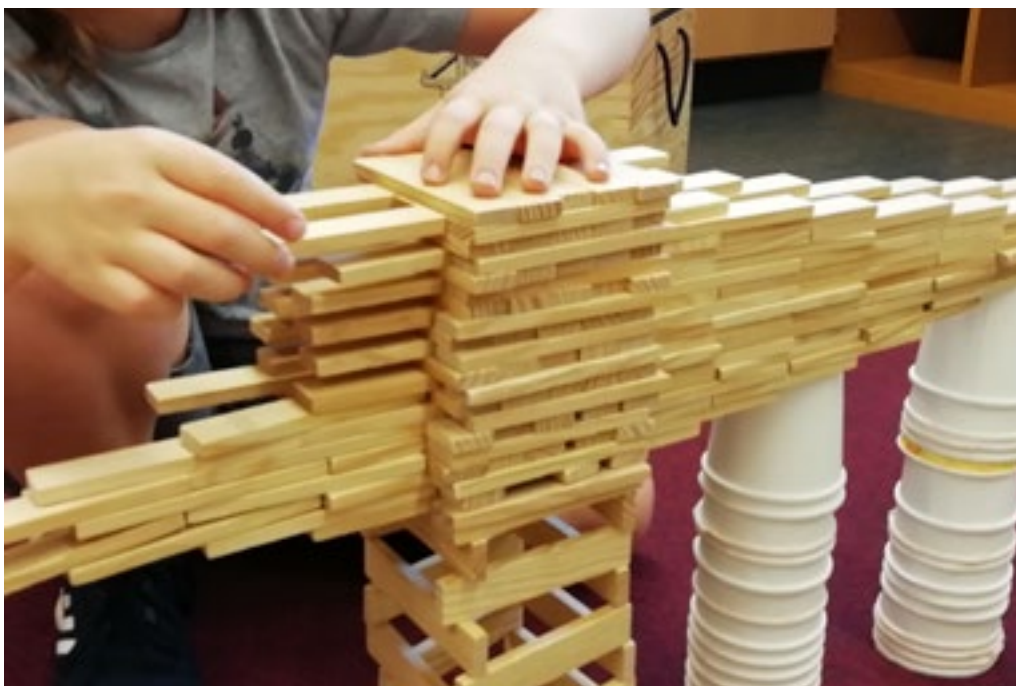
Arcus, Maison Relais Mamer