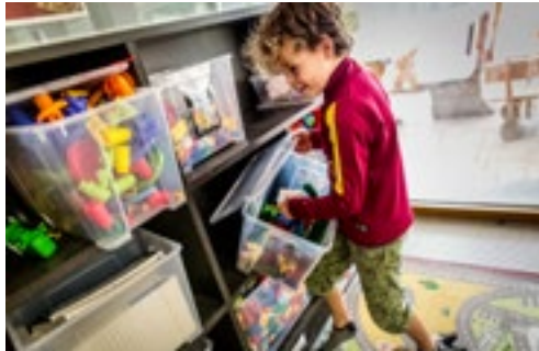
Maison Relais Schengen

Bei der Materialauswahl erfolgt die „Partizipation“ der Kinder auf direkte oder indirekte Weise. Durch Beobachten können wir die Interessen, Bedürfnisse, Neigungen und Fähigkeiten der Kinder ermitteln und diese so bei der Raumgestaltung oder der Auswahl an Materialien berücksichtigen und mit einfließen lassen.