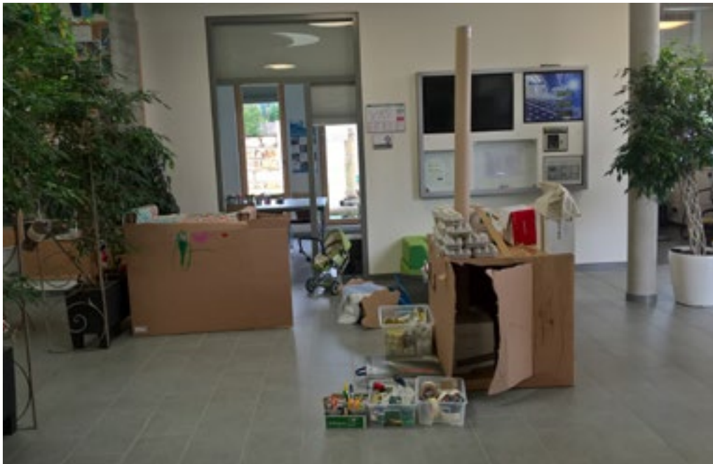
Arcus, Maison Relais Garnich