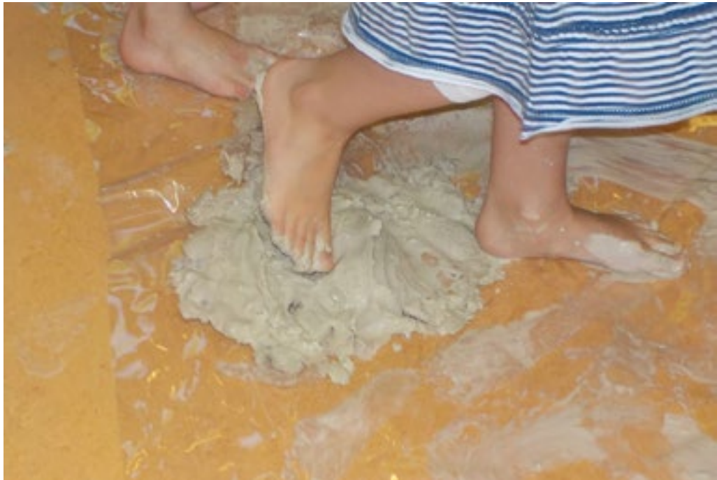
Arcus, Maison Relais Garnich