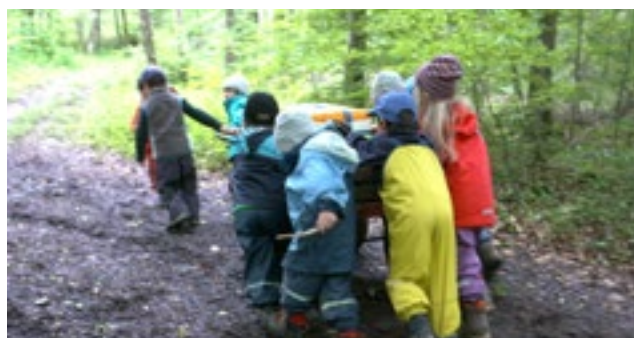
Film Arcus & SNJ, Bewegung, Gesundheit und Körperbewusstsein

Kinder knüpfen meist schnell neue Kontakte. Im Umgang mit anderen Kindern lernen sie, Gefühle und Emotionen anderer bewusst wahrzunehmen. Zudem erfahren sie Werte wie Respekt, Toleranz und Akzeptanz und lernen mit Konflikten umzugehen. Sie bauen Beziehungen auf und stärken ihre